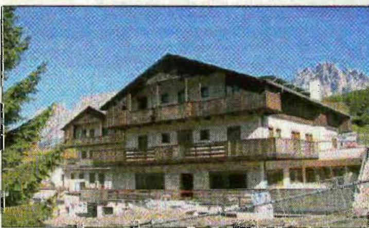
A ZUEL Ecco il "Rosapetra" in fase di ultimazione: aprirà all'inizio del 2011