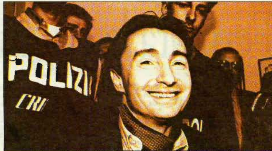
BOSS Felice Maniero, il capo della mala del Brenta che terrorizzò il Veneto negli anni '80 e '90